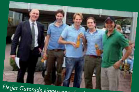
Flesjes Gatorade gingen naar het langzaamste team, tevens tweede prijs winnaars, Allen & Overy.