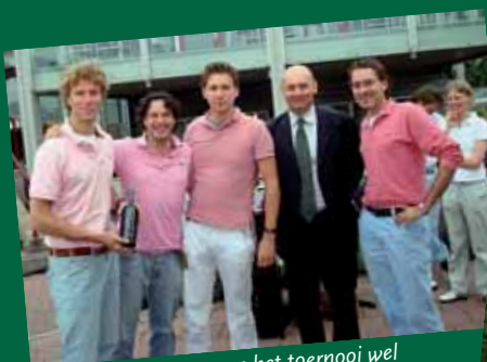
Sommige teams namen het toernooi wel erg serieus en kwamen in tenue... en werden daarvoor beloond met een fles port (vanwege de roze teint die ze hadden uitgekozen).