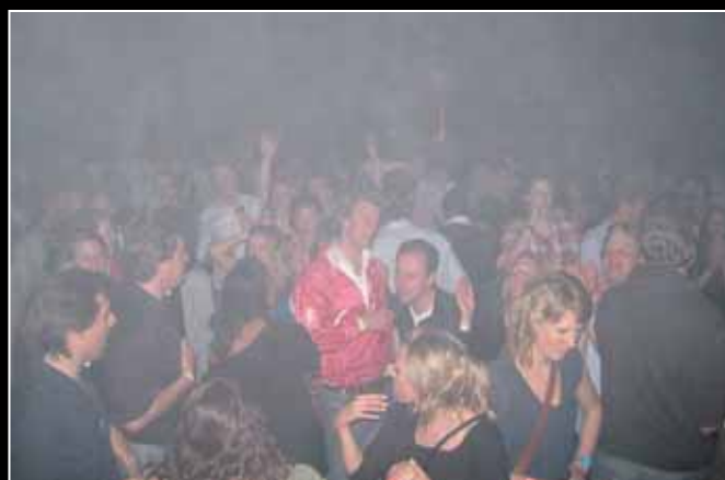
>>> Meer foto's van Justitia 2010 op www.justitia.nl <<<