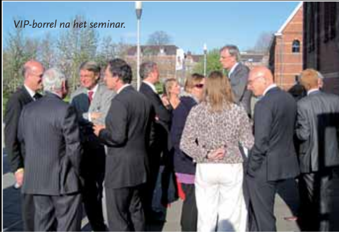
VIP-borrel na het seminar.