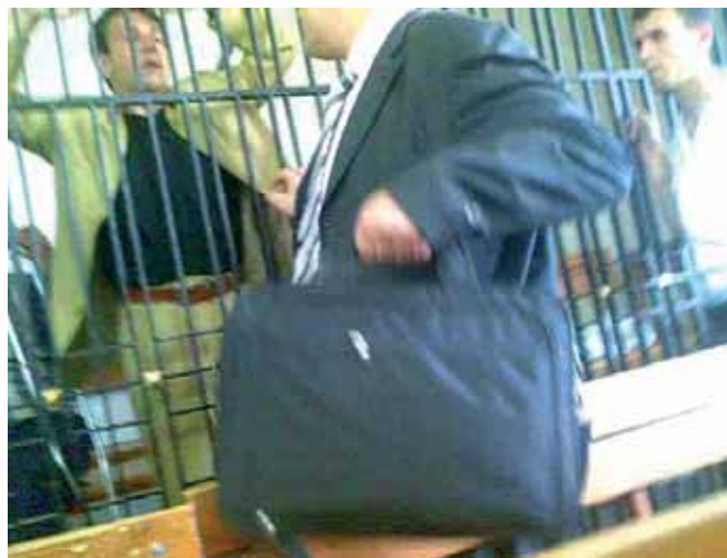
Illegaal en met telefoon gemaakte foto van het proces.

In drie brieven heeft de staatsveiligheidsdienst een serie aanklachten geformuleerd, die neerkomen op het meermalen “aantasten van