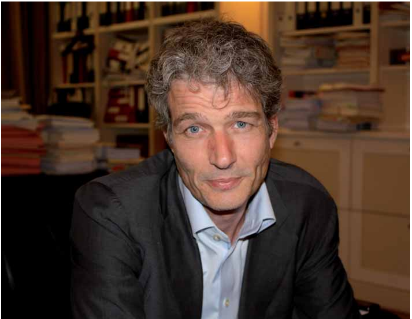
Franken: "Het zou de media sieren enige terughoudendheid te betrachten."

Maar rechters zijn ook mensen, die lezen ook kranten, kijken ook televisie. Het probleem is dat je niet kunt uitsluiten dat daar toch een bepaalde mate van beïnvloeding vanuit gaat.