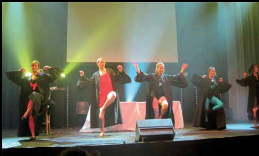
Cabaret: yoga in je toga.