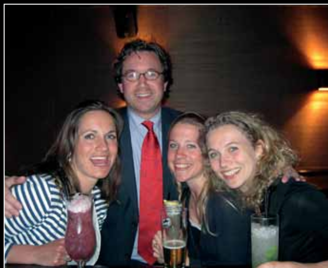
Het Jonge Balie-bestuur tijdens de pleitborrel op donderdagavond in Marquee.