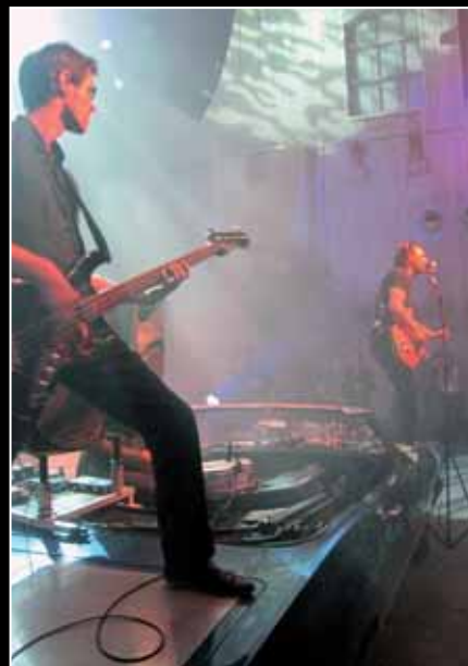
Eindfeest op het Westergasterrein.