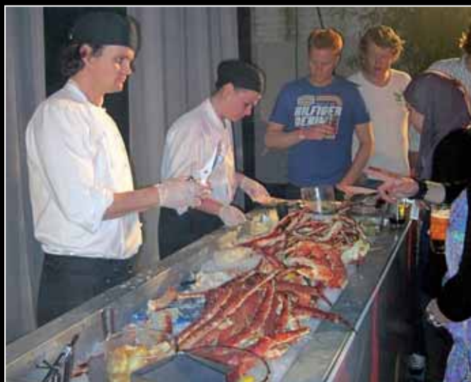
De unieke Kingscrab-bar.