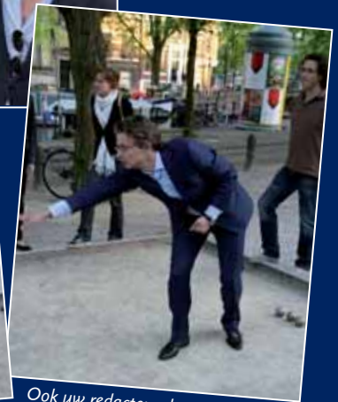
Ook uw redacteur doet een balletje.

Al met al lijkt een borrel voor (jonge) beoefenaars van een specifiek rechtsgebied een welkome aanvulling op de borrelmogelijkheden voor leden van de Amsterdamse balie. Vraag is of deze (borrel) ontwikkelingen navolging vinden bij andere gespecialiseerde leden van de Amsterdamse balie, het ABB wordt hiervan graag op de hoogte gehouden.