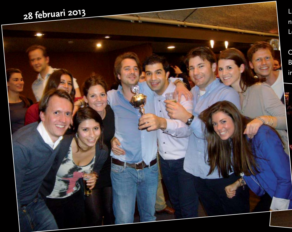
Links: Het winnende team van Loyens.